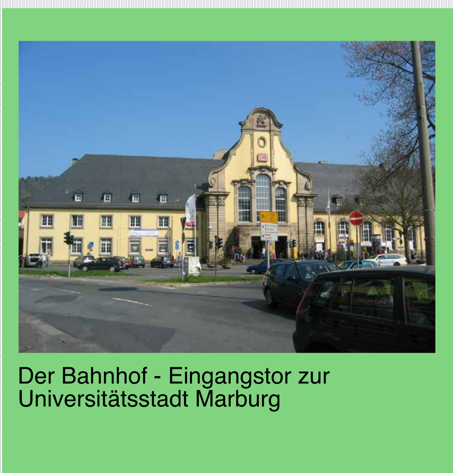
Der Bahnhof - Eingangstor zur Universitätsstadt Marburg